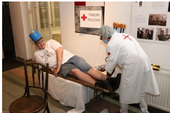
Damjanich János lábtöréssel