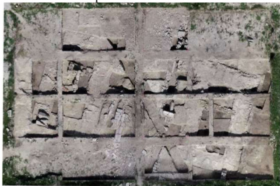
Az északi szelvény

A geofizikai eredmények alapján tűztük ki az északi szelvényt 600 m 2 -en (20 x 30 m), majd elvégeztük a felszín gépi és kézi humuszolását. Ezután feltártuk a porta praetoria két kaputornyát, valamint a köztük elhelyezkedő kapunyílást. A feltárt táborkapu szerkezete igazolta a geofizikai mérések eredményeit. Mind a kaputornyok, mind az azokat összekötő kapunyílások masszív kőalapozással rendelkeztek, a felmenő falakból azonban mindössze néhány kváderkő maradt a helyén. A tornyok belső szerkezetéről így kevés információval rendelkezünk, a nyugati toronyban egy későbbi átépítés nyomait sikerült azonosítanunk, a keleti toronyban pedig egy masszív meszes réteget találtunk, ami egy átépítéshez, vagy esetleg a torony lebontásához kapcsolható.