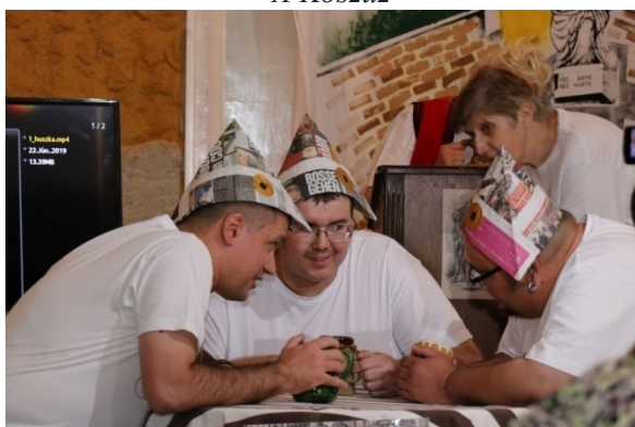
A császári dzsidások