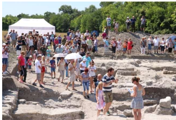
Látogatók a nyílt napon