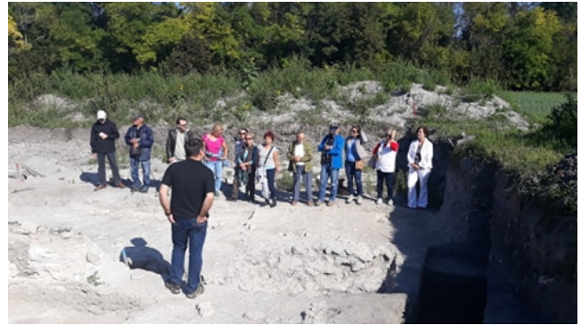
Vezetés a Kulturális Örökség Napjain

Ezen kívül nyáron 3 táborozós, szeptemberben 4 iskolai csoportot fogadtunk az ásatáson, összesen 180 fővel.