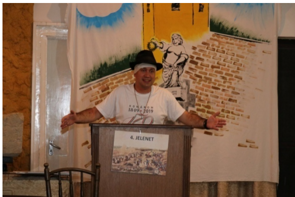
A sebesült Görgei