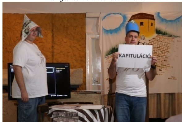
Haynau és Klapka „találkozása”

2019. július 24-én nyílt napot tartottunk az ásatáson. Résztvevők: 200 fő