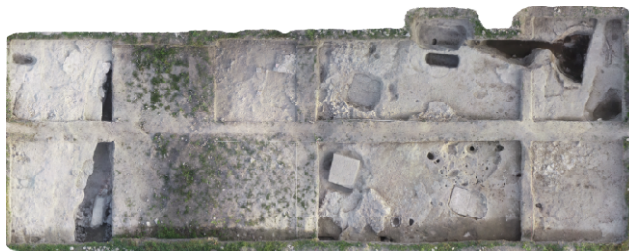
A déli szelvény

Szintén ebből a kaputornyóból került elő több mint egy tucat kő katapultgolyó. A kapu belső szerkezetének feltárását megnehezítette egy újkori csatorna, amit a kapunyíláson vágtak keresztül. Ennek ellenére sikerült feltárnunk a kapunk keresztülvezető via praetoria kőlapokkal fedett útfelületének egy részét, valamint az erre merőleges, szintén részben kőlapokkal fedett via sagularis egy szakaszát. A kaputornyok mindkét oldalán azonosítottuk a táborfalak kiszedett helyeit, amelyek a tornyok északi, külső sarkaihoz csatlakoztak keletről és nyugatról.