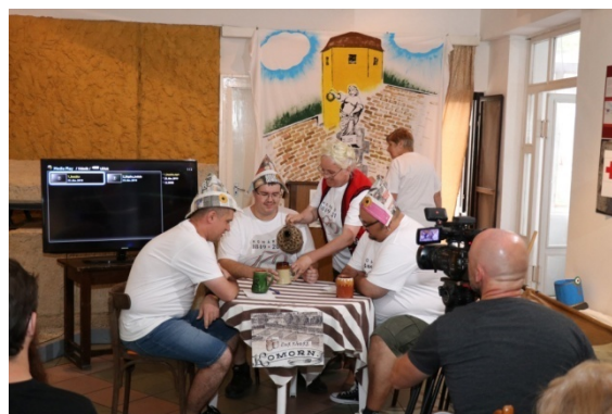
A császári dzsidások